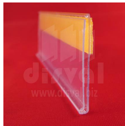
PE1126 Porta-etiquetas transparente de 1-1/4" de alto y 48" de largo con adhesivo. Paquetes de 50 unidades.