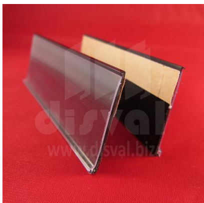
PE1127 Porta-etiquetas negro de 1-1/4" de alto x y 48" de largo con adhesivo. Paquetes de 50 unidades.