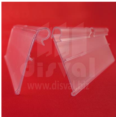
GA5134 Porta-etiquetas transparente de 1-1/4" de alto y 3" de largo para ganchos T y fish. Paquetes de 100 unidades.