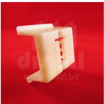
PR3343 Porta-rótulos tipo piraña. Paquetes de 50 unidades.