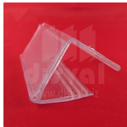
PR3349 Porta-rótulos para estantes de madera para espesores de 1". Paquetes de 25 unidades.