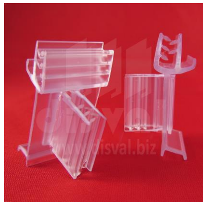
PR3341 Porta-rótulos para góndolas de doble posición. Paquetes de 250 unidades.