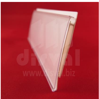
PE1122 Porta-etiquetas blanco de 1-1/4" de alto y 48" de largo con pestaña. Paquetes de 50 unidades.