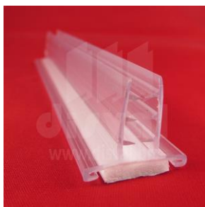
PR3365 Porta-rótulos transparente de 1" de ancho y 6" de largo con adhesivo en la base. Paquetes de 50 unidades.