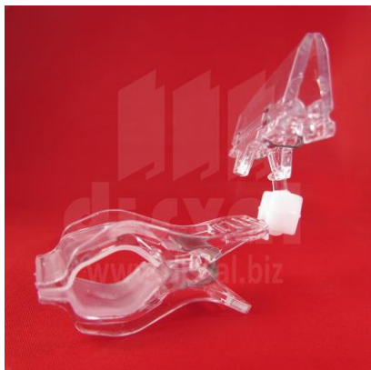
PR3336 Porta-rótulos Clip-On con prensa grande. Paquetes de 25 unidades.