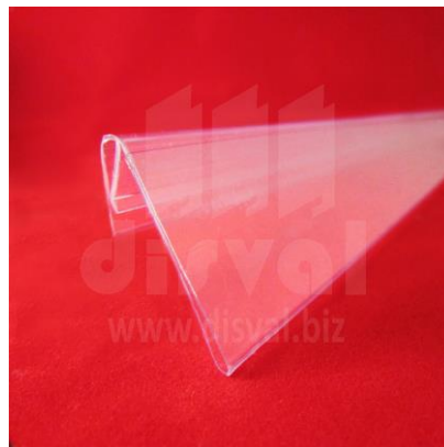
PE1152 Porta-etiquetas inclinado transparente de 1-1/4" de alto y 47-3/4" de largo. Paquetes de 25 unidades.