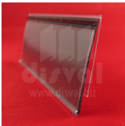
PE1124 Porta-etiquetas negro de 1-1/4" de alto y 48" de largo con pestaña. Paquetes de 50 unidades.