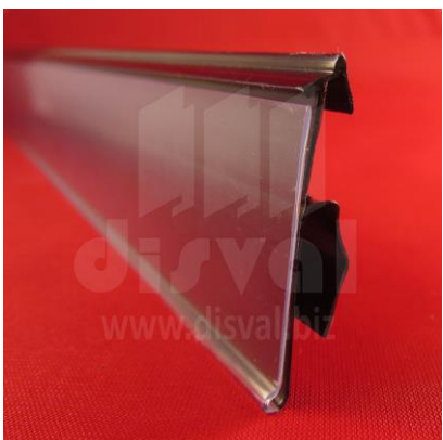
PE1165 Porta-etiquetas negro de 1-1/4" de alto y 30" de largo con pestaña para ambientes fríos. Paquetes de 25 unidades.