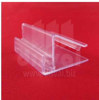
PR3348 Porta-rótulos para estantes de madera para espesores de 1/2". Paquetes de 25 unidades.