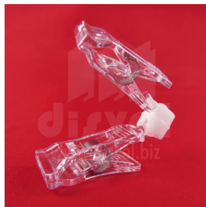
PR3333 Porta-rótulos Clip-On con doble prensa pequeña. Paquetes de 50 unidades.