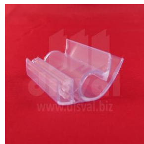
PR3399 Porta-rótulos para varilla de metal. Paquetes de 50 unidades.