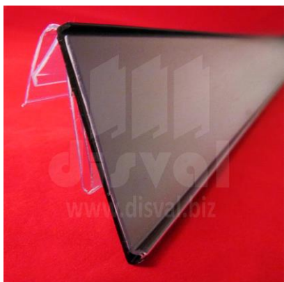
PE2852 Porta-etiquetas negro de 2" de alto y 48" de largo con adaptador PE1152. Paquetes de 10 unidades.