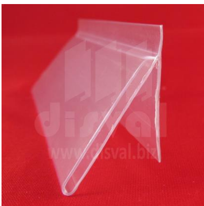
PE1166 Porta-etiquetas transparente de 1-1/4" de alto y 47.70" de largo, inclinado y con adhesivo. Paquetes de 25 unidades.