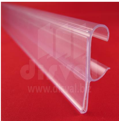
PE1147 Porta-etiquetas transparente de 1-1/4" de alto y 29-1/2" de largo para doble varilla. Paquetes de 12 unidades.