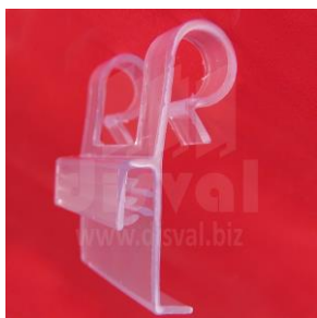
PR3353 Porta-rótulos doble gancho para barandas. Paquetes de 100 unidades.