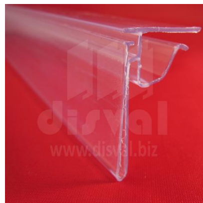
PE1141 Porta-etiquetas transparente de 1-1/4" de alto y 47-3/4" de largo para estantería de vidrio. Paquetes de 12 unidades.