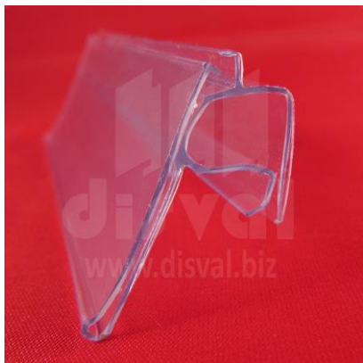
PE1143 Porta-etiquetas transparente de 1-1/4" de alto y 46-1/4" de largo para varilla y barandas de metal. Paquetes de 25 unidades.