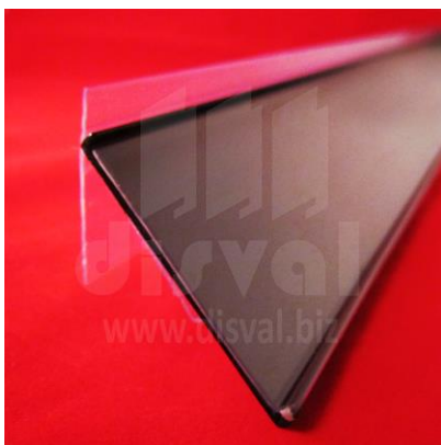
PE2866 Porta-etiquetas negro de 2" de alto y 48" de largo con adaptador PE1166. Paquetes de 10 unidades.