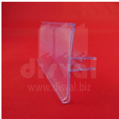
GA5133 Porta-etiquetas transparente de 1-1/4" de alto y 3" de largo para gancho L. Paquetes de 50 unidades.