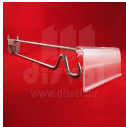
GA5182 Gancho de seguridad de 9-3/4" de largo y 0.212" de espesor con porta-etiquetas de 1-1/4" y 3" de largo. Paquetes de 25 unidades.