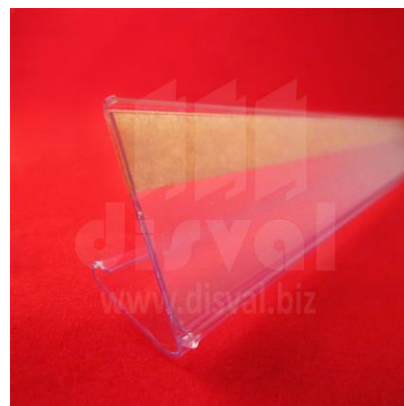
PE1170 Porta-etiquetas transparente de 1-1/4" de alto y 47-9/16" de largo. Paquetes de 50 unidades.