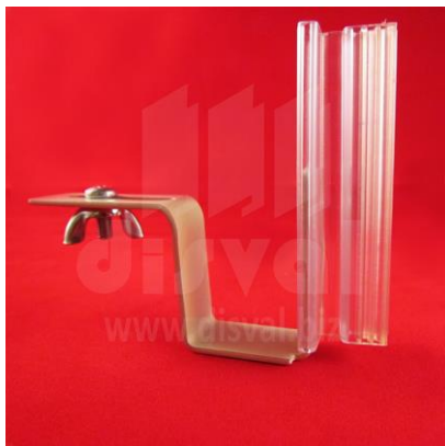
PR3313 Porta-rótulos de bisagra de 3" con soporte de metal para espesores de 0.100" hasta 0.250". Paquetes de 25 unidades.