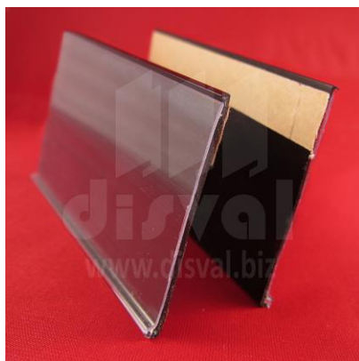
PE1128 Porta-etiquetas negro de 2" de alto y 48" de largo con adhesivo. Paquetes de 25 unidades.